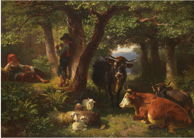
Hirtenkinder im Wald mit Kühen und Schafen

Obwohl die Kuh ein Steppentier ist, lässt sie sich gerne im Wald oder im Gehölz nieder. Dort findet sie Schutz und Geborgenheit für das Wiederkäuen oder für Ruhepausen.